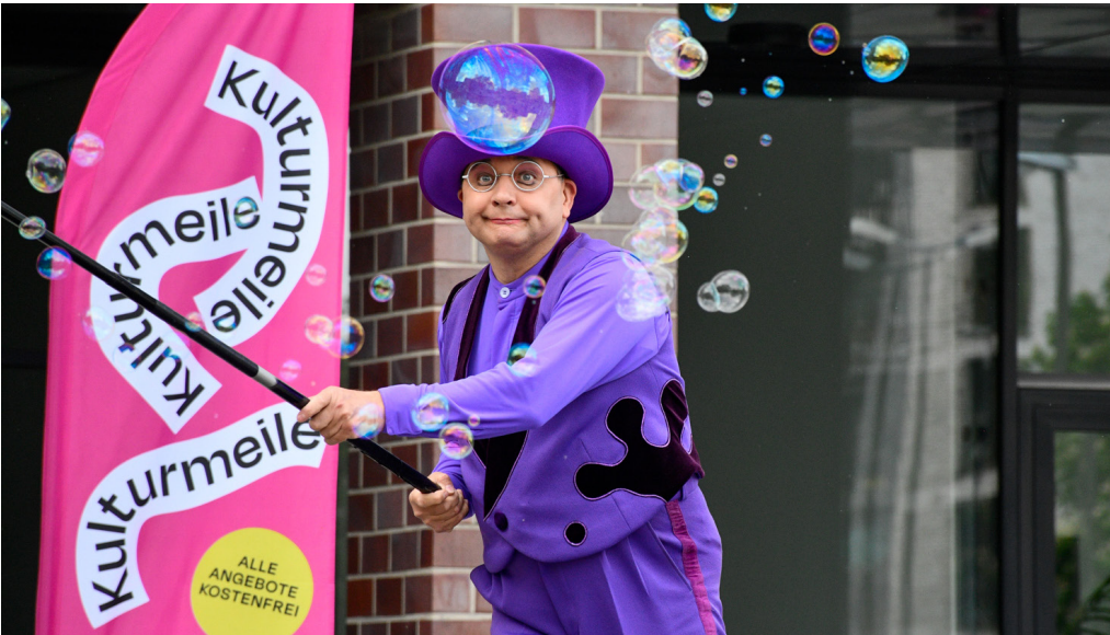
Acht Kulturorte, vom Dortmunder U bis zum Museum für Kunst- und Kulturgeschichte, präsentieren geballtes Programm bei der Kulturmeile am 11. und 12. Mai.