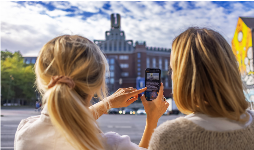
Ob Tipps für spontane Kulturausflüge, Erläuterungen zur Kunst im öffentlichen Raum, Behördentermine oder die neuesten Nachrichten aus der Stadt: Mit der Dortmund-App ist alles nur einen Klick entfernt.

Bereits im Herbst 2023 hatte die Stadt Dortmund ihre komplett überarbeitete Online-Präsenz an den Start gebracht. Unter dortmund.de können Nutzer*innen nun schneller und einfacher zu gewünschten Inhalten gelangen. Gleichzeitig mit dem neuen dortmund.de hatte die Stadt die erste eigene App vorgestellt. Es gibt sie kostenlos im App-Store von Apple oder im Google-Play-Store. Die technischen Grundlagen entwickelte das Chief Information/Innovation Office (CIIO) der Stadt Dortmund gemeinsam mit 15 anderen Kommunen.