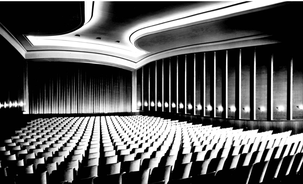
Einen glanzvoll-eleganten Rahmen für Filmerlebnisse stellte der Kinosaal des Film Casinos in den 1950er-Jahren dar. Heute, rund 70 Jahre später, bietet der leere Saal ein karges Bild – doch bald soll neues Leben einziehen.

Welche Zukunft könnte das Film Casino haben? Das soll nun eine Machbarkeitsstudie ermitteln. Ideen gibt es schon: DORTMUND MUSIK, ehemals Musikschule Dortmund, wünscht sich für ihre Ensembles und Orchester Räume für die regelmäßige Probenarbeit. Die eigenen Räumlichkeiten in der Steinstraße geben das kaum her. Für den Konzertbetrieb der Orchester gibt es zurzeit gar keine geeigneten Räumlichkeiten. Doch nicht nur die Kulturbetriebe haben ihr Interesse am Film Casino bekundet. Das richtige Konzept soll mit der Machbarkeitsstudie gefunden werden. Sie wird sich aber auch intensiv mit dem baulichen Zustand des Gebäudes beschäftigen: Die Statik, Schadstoffe, das Gefälle im Kinosaal sowie der Denkmalschutz spielen dabei eine Rolle. Der lange Leerstand hat gewiss Spuren hinterlassen, das Haus aber vor einem willkürlichen Totalumbau bewahrt. Vieles ist noch so erhalten, wie es ursprünglich angelegt war. Diese Chance für eine besondere Adresse mit einem Glanzstück in der City hat die Stadt jetzt mit dem Kauf gesichert. Sie möchte sie nutzen, auch wenn es dafür einen längeren Atem braucht.