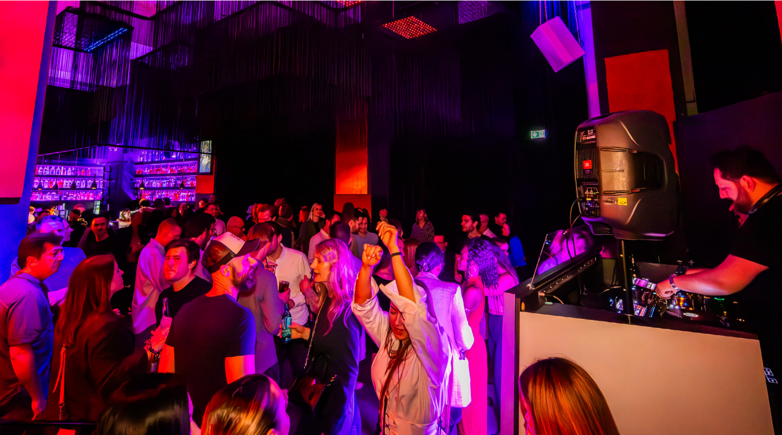
Feiern und Tanzen bis ins Morgengrauen ist nun jederzeit möglich: Die Sperrstunde ist in Dortmund abgeschafft, ebenso wie die Vergnügungssteuer.