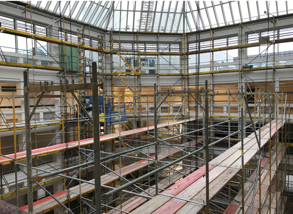
In der Sanierungszeit durchzog ein Baugerüst die Bürgerhalle bis hoch unter die Glaskuppel.