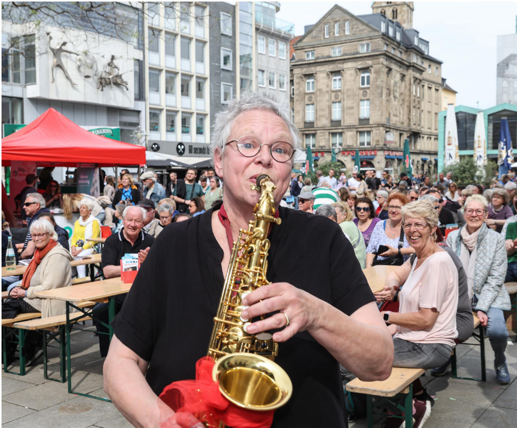
Musik und das Miteinander spielen bei DORTBUNT wichtige Rollen – in der City, in den Nachbarschaften und im Netz.

Dortmund feiert am ersten Mai-Wochenende seine Vielfalt