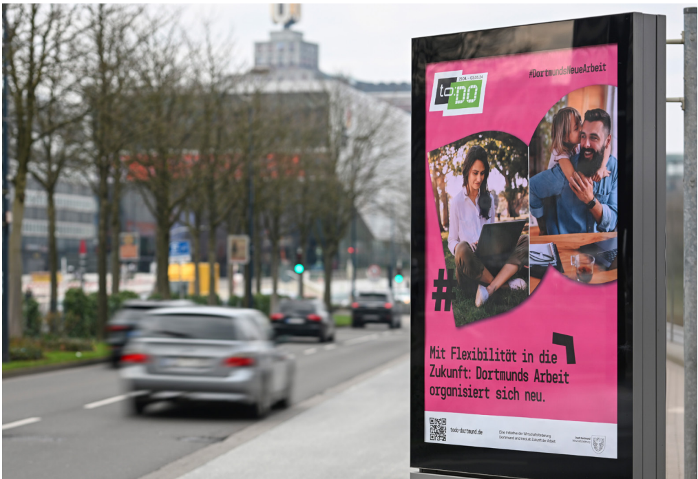
Mit Punkten wie der Vereinbarkeit von Familie und Beruf, dem Fachkräftemangel und dem demografischen Wandel beschäftigt sich die to:DO-Veranstaltungswoche.

Mit einer ganzen Veranstaltungswoche in der City rückt die Zukunft der Arbeit in den Fokus der Stadt. Unter dem Titel „to:DO – Dortmunds neue Arbeit“ geht es vom 29. April bis 3. Mai im Baseology an der Kampstraße um ganz verschiedene Perspektiven zu dem Thema. Die gleichnamige Initiative hat das InnoLab Zukunft der Arbeit unter Federführung der Wirtschaftsförderung ins Leben gerufen.