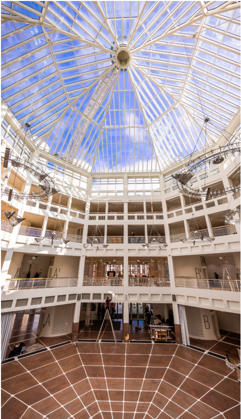
Die Architektur der Bürgerhalle kommt wieder voll zur Geltung.