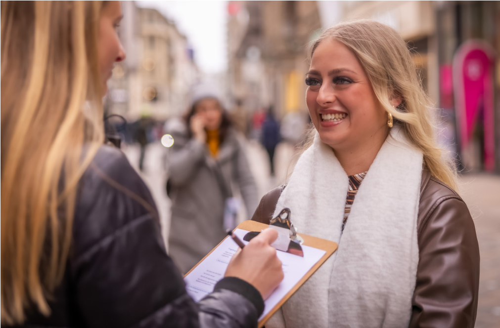
400 Passant*innen standen allein in der ersten Erhebungswelle im November Rede und Antwort. Sie stellten der Vielfalt der City ein gutes Zeugnis aus.

In einer Umfrage der Stadt zeigen sich Passant*innen zufrieden mit der Innenstadt